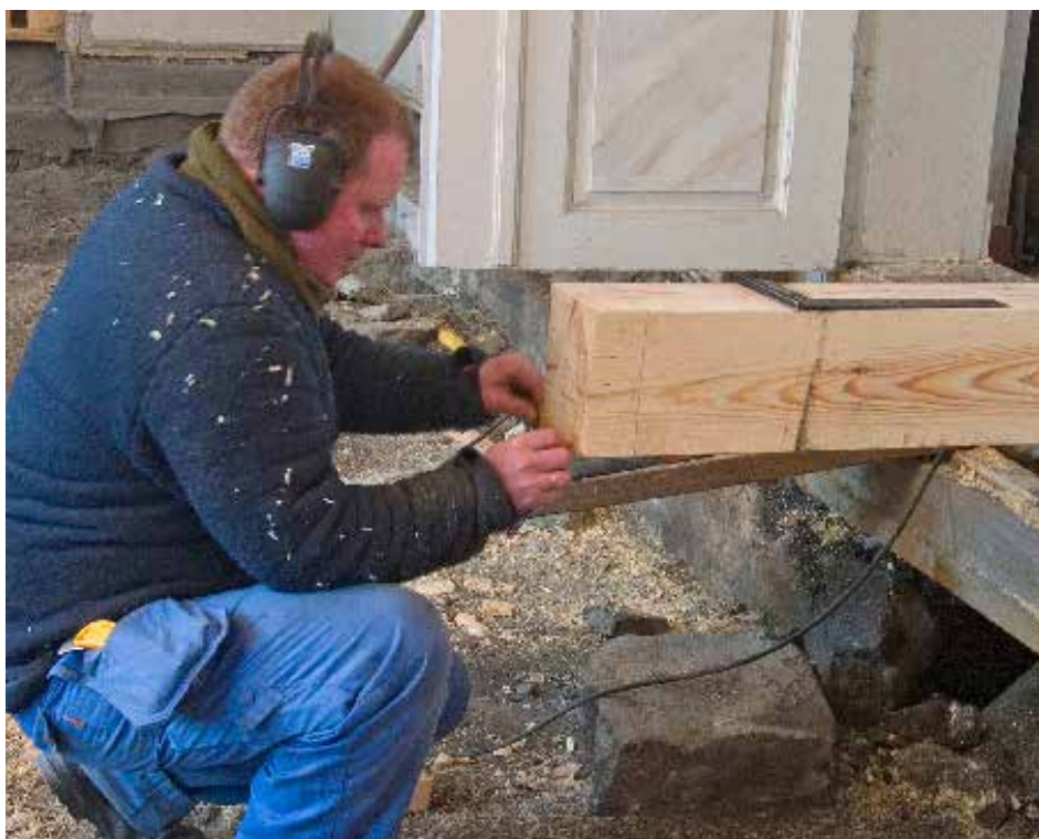
Tømreren forbereder tilskjæring av tapp i stolpeende som skal skjøtes inn i den gamle bindingsverkskonstruksjonen.

Veggen er nå blottlagt og fyllmassene i de nedre fagene av bindingsverket er tatt ned. Himlingsbjelkene er stemplet opp for å lette presset på veggpartiet. Tømrer har laget et forslag til konstruksjon bestående av bunnsvill i kortere deler sammenføyd med svalehaler. Stykkene er forholdsvis korte og skal ha tapphull nær skjøtene. De nye stenderendene tappes ned i bunnsvillen og forbindes med de friske partiene av stenderne i veggen med en en skrå skjøt (skrått blad med fasettende, og festes med linoljeinnsatt plugg som kiles. Konstruksjonen gjøres ferdig på forhånd og monteres i veggen stykkevis. Deretter fylles bindingsverket. Før konstruksjonen lukkes, går den over og repareres med lermørtel der det har oppstått gliper og luftlekkasjer. Videre arbeider med innvendig veggkledning og bjelkelag i gulv foreslås i eget forslag.