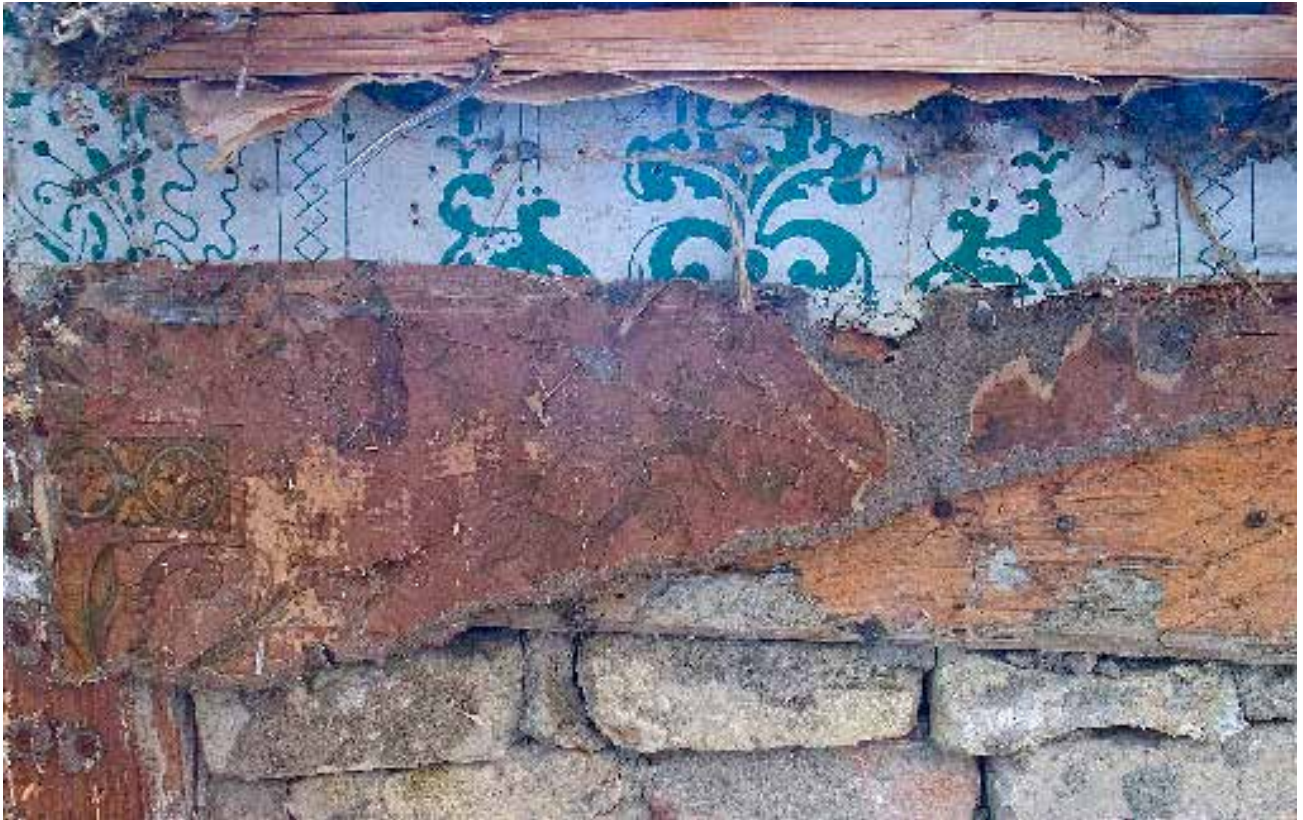
Over: Papirtapetfragment på papp over den eldre papirtapeten på linlerret.