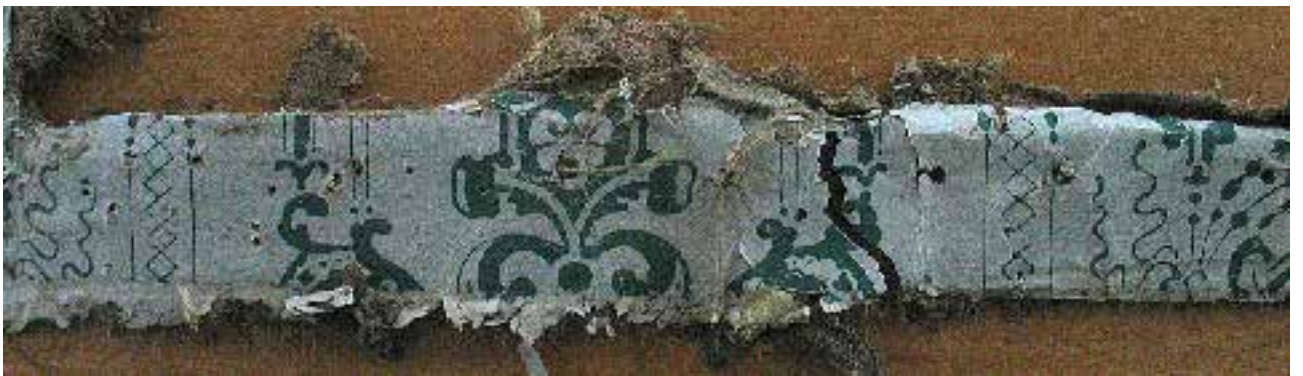
Under: Flere fragmenter av det eldste papirtapetet på linlerret.