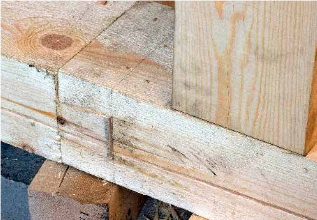
Sinkforbindelse og prøving av tapping. Tilpasningen var svært tett og god.