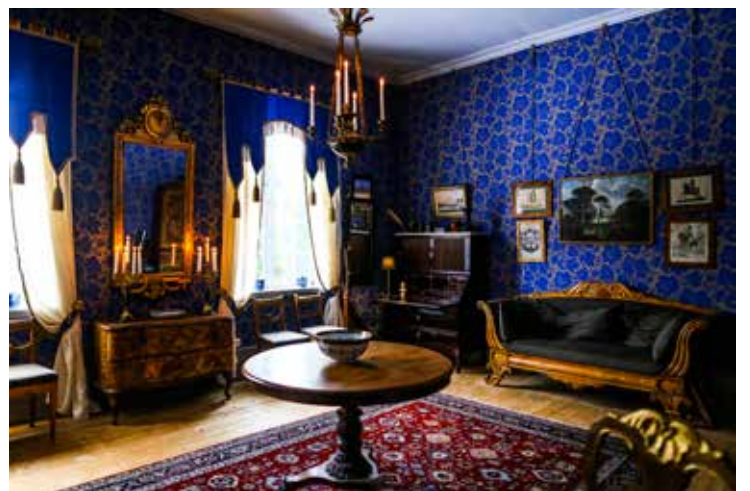
Rommet som kalles «blåstuen», er det eneste i hele huset som er tapetsert. Fra restene som ble funnet, ble tapetet rekonstruert og laget i silketrykk. Det originale var fra 1880-årene. I hjørnet står et skatoll fra 1770-årene, antagelig tegnet av C.F. Harsdorff, den andre av de tre store dansk-norske arkitektene fra den neoklassiske tiden. Sofaen er biedermeier fra ca. 1830, forsynt med løse puter innvendig. Speilet på veggen er fra 1778 og fra Stockholm. Ampelen i taket dansk- og tidstypisk. Gardinene er kopier av et interiørmaleri fra ca. 1810.