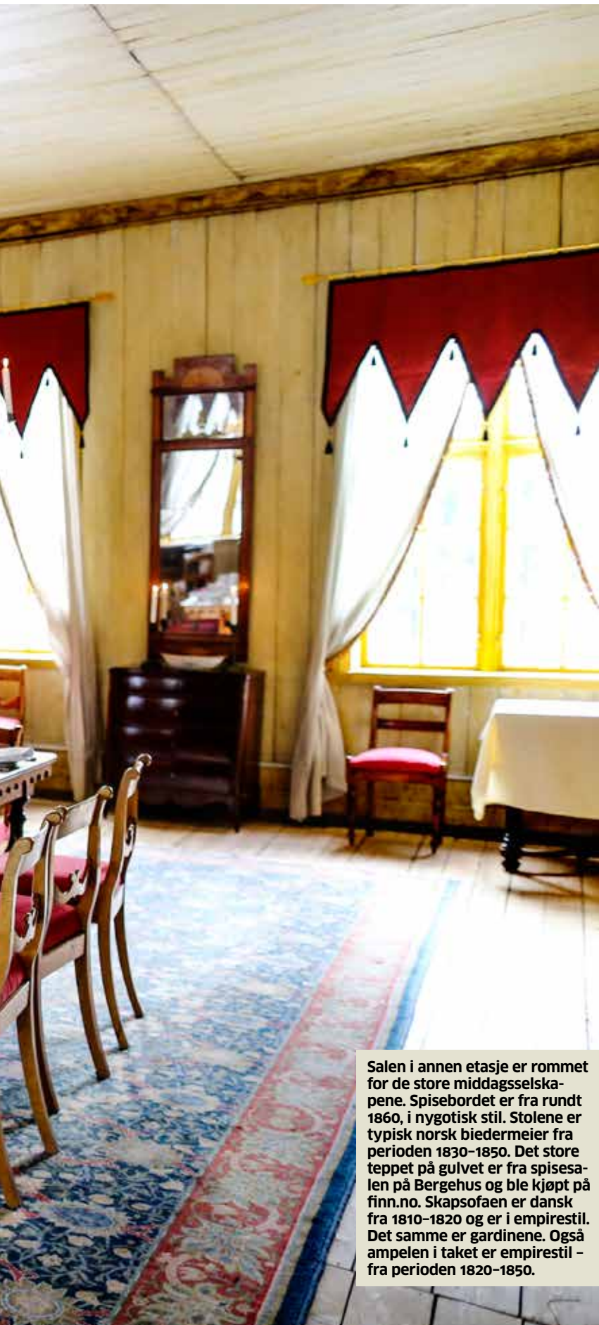
Salen i annen etasje er rommet for de store middagsselskaper. Spisebordet er fra rundt 1860, i nygotisk stil. Stolene er typisk norsk biedermeier fra perioden 1830-1850. Det store teppet på gulvet er fra spisesalen på Bergehus og ble kjøpt på finn.no. Skapsofaen er dansk fra 1810-1820 og er i empirestil. Det samme er gardinene. Også ampelen i taket er empirestil - fra perioden 1820-1850.