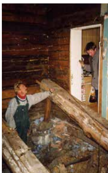
Slik så det ut på soverommet da de holdt på med restaureringen.

ringsbygg langs Elveveien er det å parkere på gårdsplassen på Yttersø en reise tilbake i tid. Ute, der fem mål hage er gått i dvale under snøen, biter kuldegradene fra seg. Vannspeilet på Lågen er vintersvart. Men kjøkkenet er lunt og kaffen glovarm der vi tenker oss rundt et kjøkkenbord som er mer rustikt i stilen enn mange av de skjellakkerte byantikvitete som ellers preger innredningen. I hjørnet er en stor og hvitkalket grue murt opp på nytt. Profilen av originalen sto igjen slik at den lot seg rekonstruere. – Kjøkken, bad og soverom er varmesone, forklarer de to. – Vi måtte bestemme oss for en fornuftig ordning med tanke på norsk vinter. Å holde hele dette huset varmt gjennom vinteren