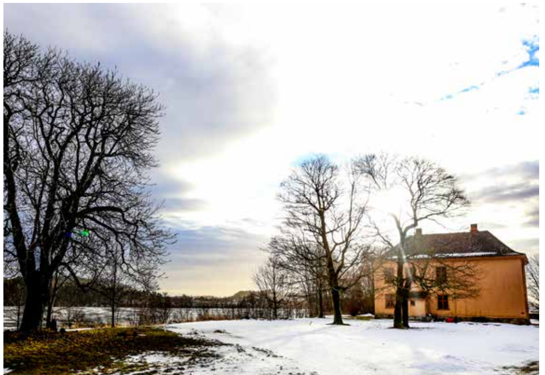
Yttersø Lystgård er fredet og ligger ved bredden av Lågen. Til sommeren skal huset males på nytt. Tuntreet til venstre kalles «puselunden». Der ligger familiens katter begravet.