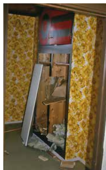
Slik så det ut i hjørnestuen før restaureringen.