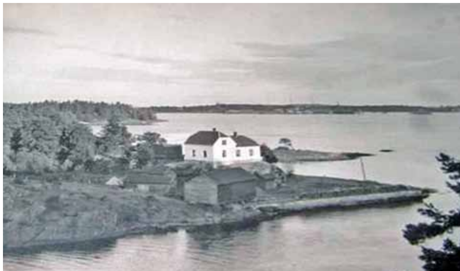
Fig. 2 - Oppsynsmannsboligen med uthus ved Strømsund. (Foto etter innrammet bilde hos Astrid Kvardal, Horten). Se billedtekst under.

Så entret Arthur Bye lok'en og tok følget med på befarings. Det må ha vært høsten 1957, rett etter Kong Haakon VIIs død.