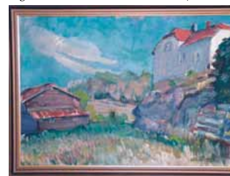
Fig. 3 - Maleri av H.L.Rasmussen 1975 (Privat eie).

Fig 5 - Neste side. Kart over Indre Havn i Horten med Karljohansvern og de tre øyene, Løvøya (kan skimtes),