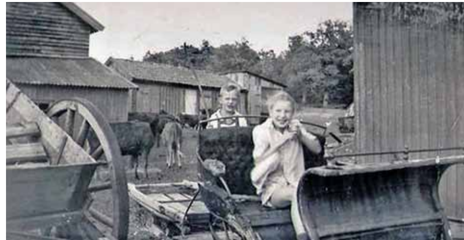
Fig.1 Gårdsplassen til oppsynsmannsboligen. Billedtekst neste side.

Arbeidet med verneplanen for Karljohansvern satte så nytt fokus på disse kulturminnene og i 2004 ble bygningen vedtaksfredet sammen med en rekke bygninger og anlegg på Karljohansvern. Men forfallet på den ubebodde oppsynsmannsboligen var kommet langt. Faretruende langt.