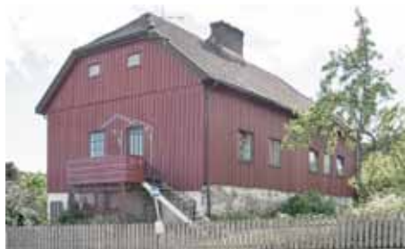
Brennerianleggets pakkbod fra 1824. I dag Vestregate 15a, tomannsbolig på Langestrand.

Et spesielt trekk ved pakkhuset (Vestregata 15a) er at det er stall og fjøs i første etasje med pakkhus og lager for korn og dyrefôr over. Bygningen var utvilsomt en integrert del av fabrikanlegget. Malteriet medførte en del avfall som