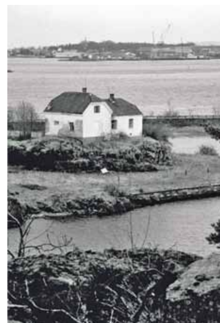
Fig. 4 - Oppsynsmannsboligen fra Masteberget 2000.

Mellomøya, Østøya og Vealøs. Oppsynsmannsboligen ligger ved innløpet til Strømsund, Masteberget på motsatt side. Jorder og eng ligger på vestsiden av Mastedammen som deler øya i to.